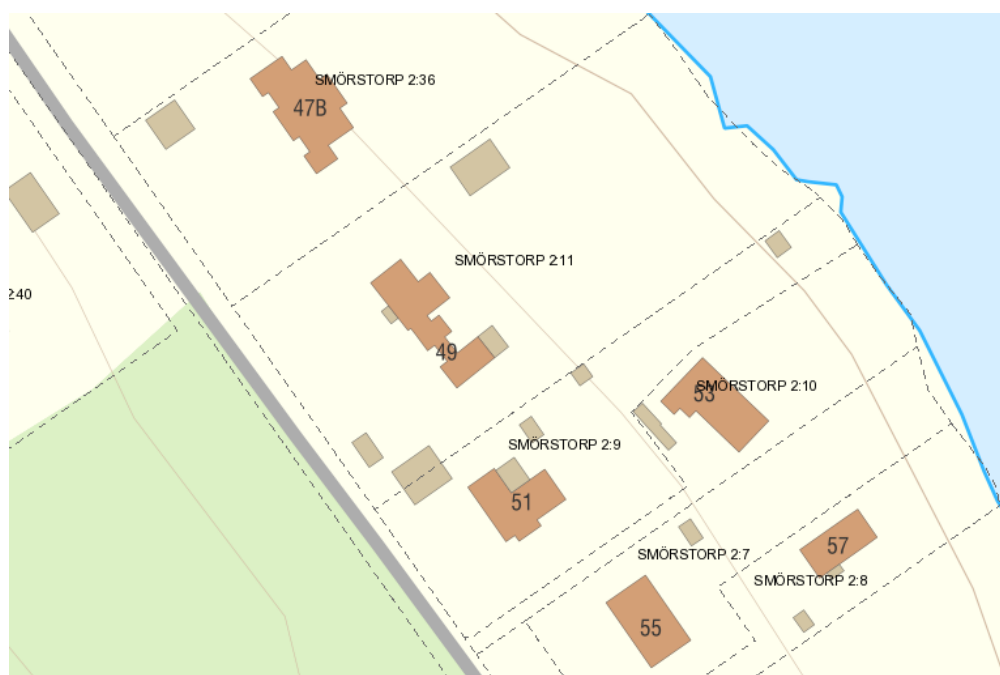
Kartan visar fastigheten Smörstorp 2:11

Boverket rekommenderar att vid ändring av detaljplaner ska bara en plankarta vara gällande, ändringarna för Smörstorp 2:11 förs därmed in på gällande plankarta. Denna planbeskrivning hanterar endast de frågor ändringen avser och biläggs gällande planbeskrivning när detaljplaneändringen vunnit laga kraft.