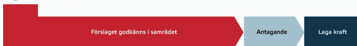
Figur 1. Begränsat förfarande.