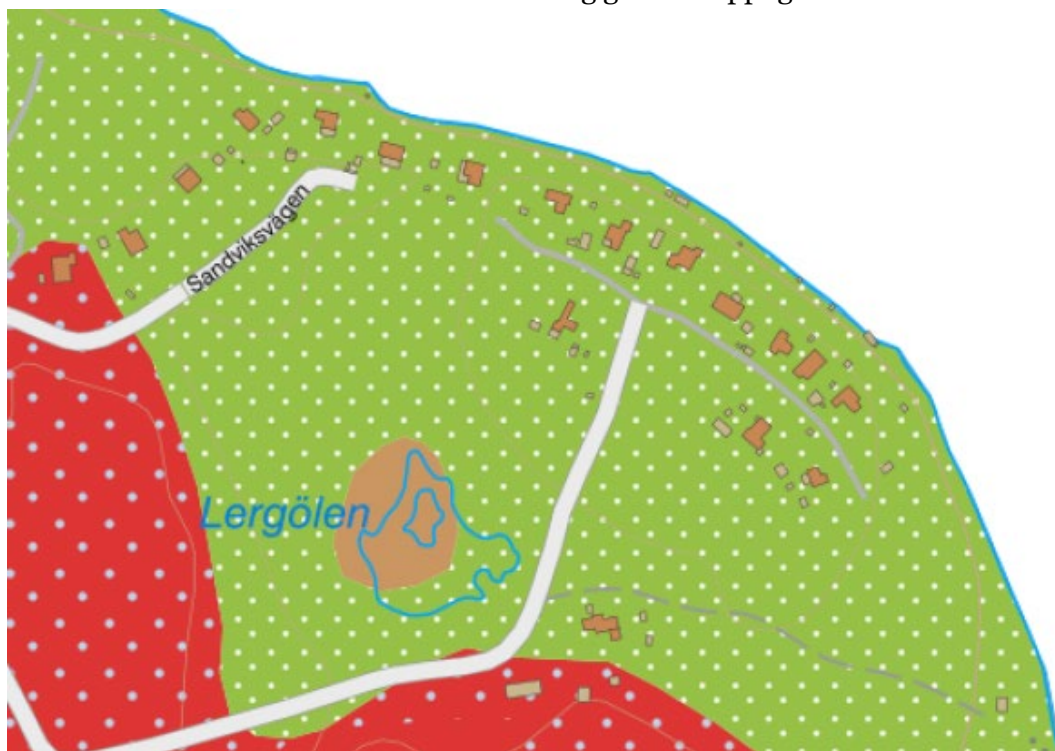
Figur 4. Utdrag ur SGU:s kartvisare Jordarter visar att området består av isälvsediment, grus.

Inom aktuellt planområde utgörs marken av isälvsediment och grus. Det är alltså inte finkornig jord som silt och lera. SGU:s kartvisare "Fastmark" visar också att marken inom berört område klassas som fastmark med hög genomsläpplighet.