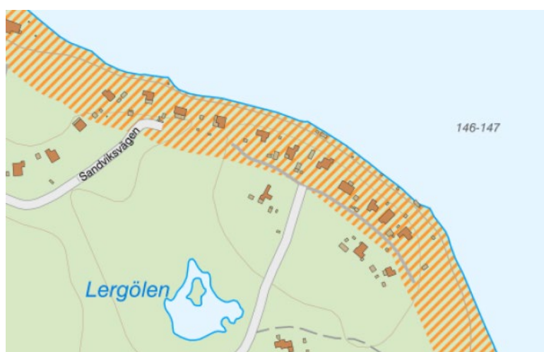
Figur 3. Utdrag ur SGU:s kartvisare "Förutsättningar för skred i finkornig jordart" visar var det finns förutsättningar för skred i finkornig jordart(främst silt och lera).

Metoden beaktar inte jordlagrens tekniska egenskaper utan betraktar alla jordlager av viss jordartstyp som skredkänsliga vid viss marklutning. Detta innebär att inom många av de identifierade aktsamhetsområdena kan jordlagrens egenskaper vara sådana att någon risk för skred knappast föreligger trots att lutningskriteriet är uppfyllt.