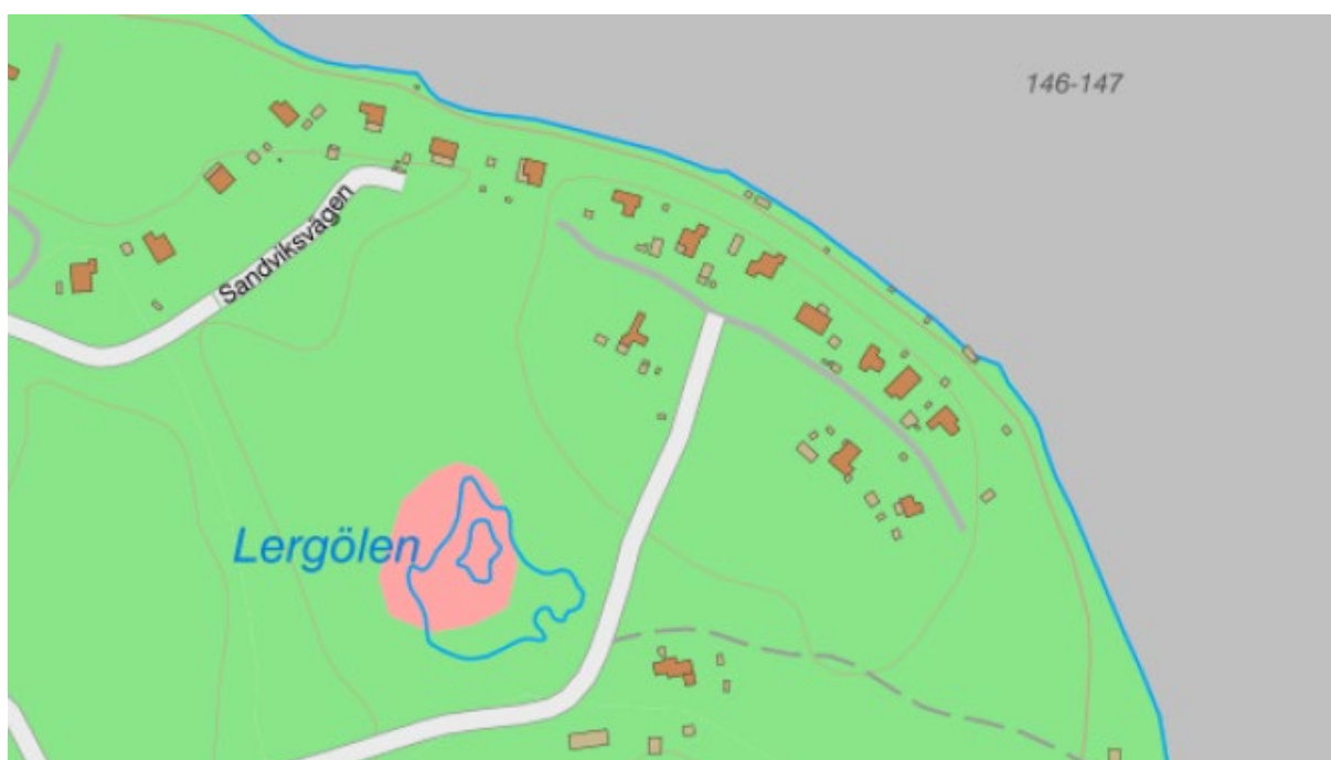
Figur 5. Utdrag ur SGU:s kartvisare Fastmark visar att området kan betraktas som fastmark med bra bärighet och genomsläpplighet.

Ställningstagande för bostäder inom planområdet är taget sedan lång tid tillbaka. Under den tiden har inga skred inträffats och det finns inga indikationer på markinstabilitet. Därtill är området med brantaste slänten mot sjön planlagt som korsmark och får endast bebyggas med mindre komplementbyggnader. Ändringsplanen möjliggör inte för nya fastigheter och