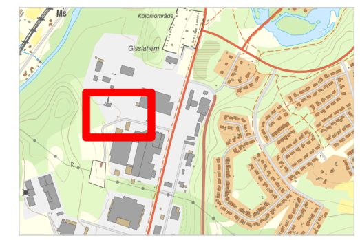
ÖVERSIKTSKARTA Skala 1:20 000 (A3)